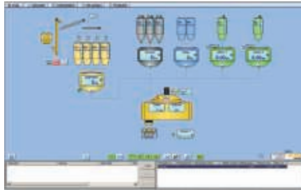
SKAKOMAT 600 S